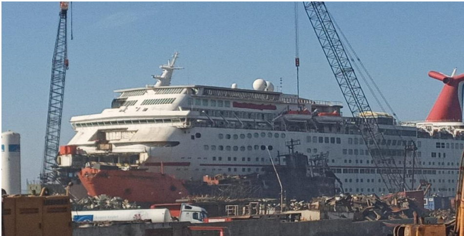
Resim 2 - Aliğa Gemi Söküm Güncel (13 Şubat 2023) – 1117 Kabin ~5000

Ülkemizde halihazırda Avrupa Birliği onaylı 8 tesis onay almış olmakla birlikte 6 tanesi yetkinliğini devam ettirmektedir. AB bayraklı yeşil dönüşüm gemi dönüşüm tesislerimiz armatör firmalar açısından tercih/zorunluluk olacaktır. Ülkemizin gemi sökümünde öncü olması ve yeşil dönüşümde yapmış olduğu çalışmalarla avantajlı bulunduğu bu alanlarda müşterilere farklılık sunacaktır.